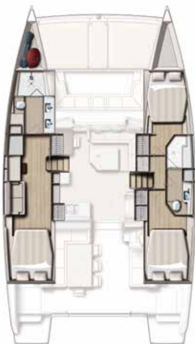
Version 3 cabins / 2 SDB 3 cabin version / 2 bath Versión 3 camarates / 2 cuartos de baños 3 Kabinen, 2 Bäder