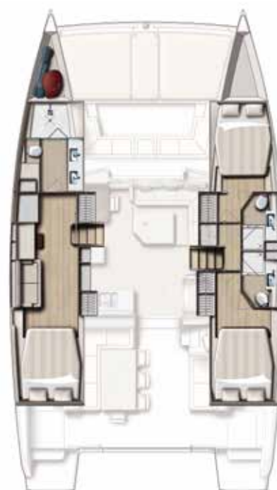
Version 3 cabins / 3 SDB 3 cabin version / 3 bath Versión 3 camarates / 3 cuartos de baños 3 Kabinen, 3 Bäder