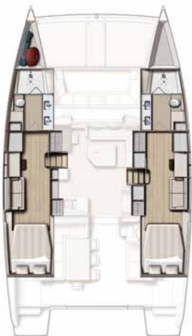
Version 2 cabins / 2 SDB 2 cabin version / 2 bath Versión 2 camarates / 2 cuartos de baños 2 Kabinen, 2 Bäder

CUSTOMISE YOUR OPEN SPACE | DESARROLLAR SU OPEN SPACE | WOHNEN AUF DER BALI 4.5